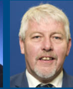
Gunnsteinn Björnsson Vize Präsident