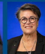
Eliane Ort-Scheffer KI House